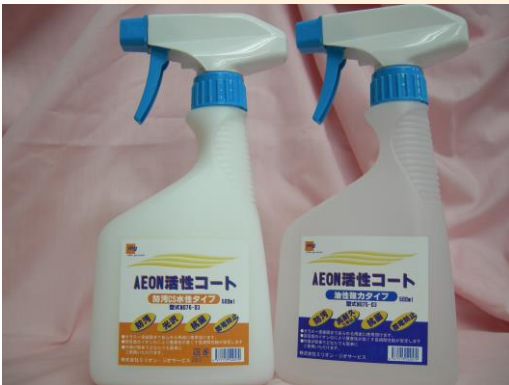
M076 ■ 防汚 CS 水性 M075 ■ 油性強力タイプ 容量：500ml スプレー 2L 4L 18L