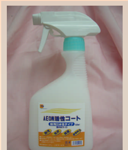
M076：水性ツヤ出しタイプ