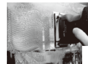
オービタルサンダー作業

購入前の相談などございましたらお気軽にお問合せください。【Qweb検索 ☞ ガラピカ】