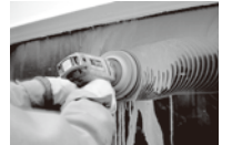
ポリッシャー作業